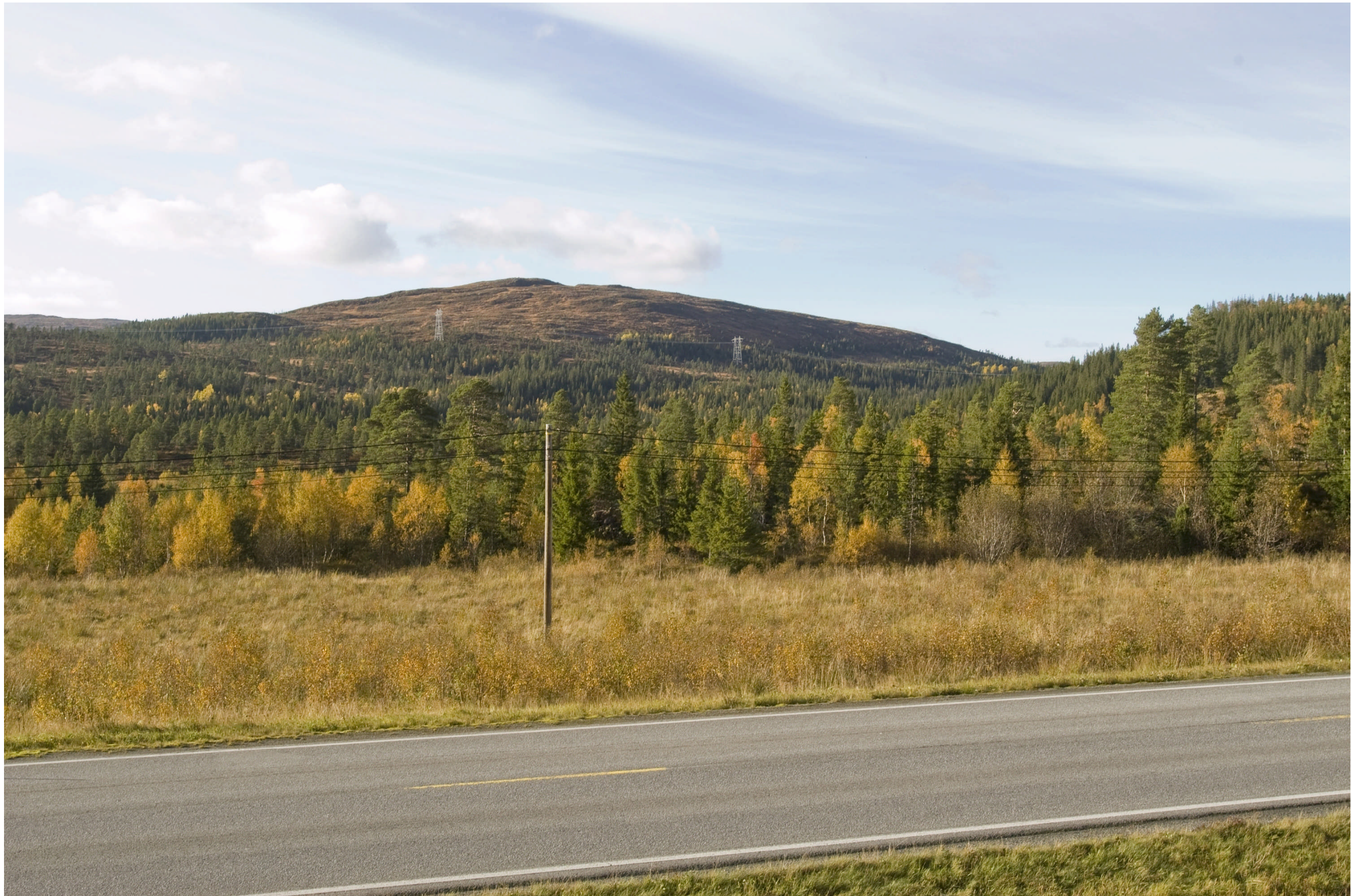
Alternativ 1.0 under Marikammen sett fra riksvei 715