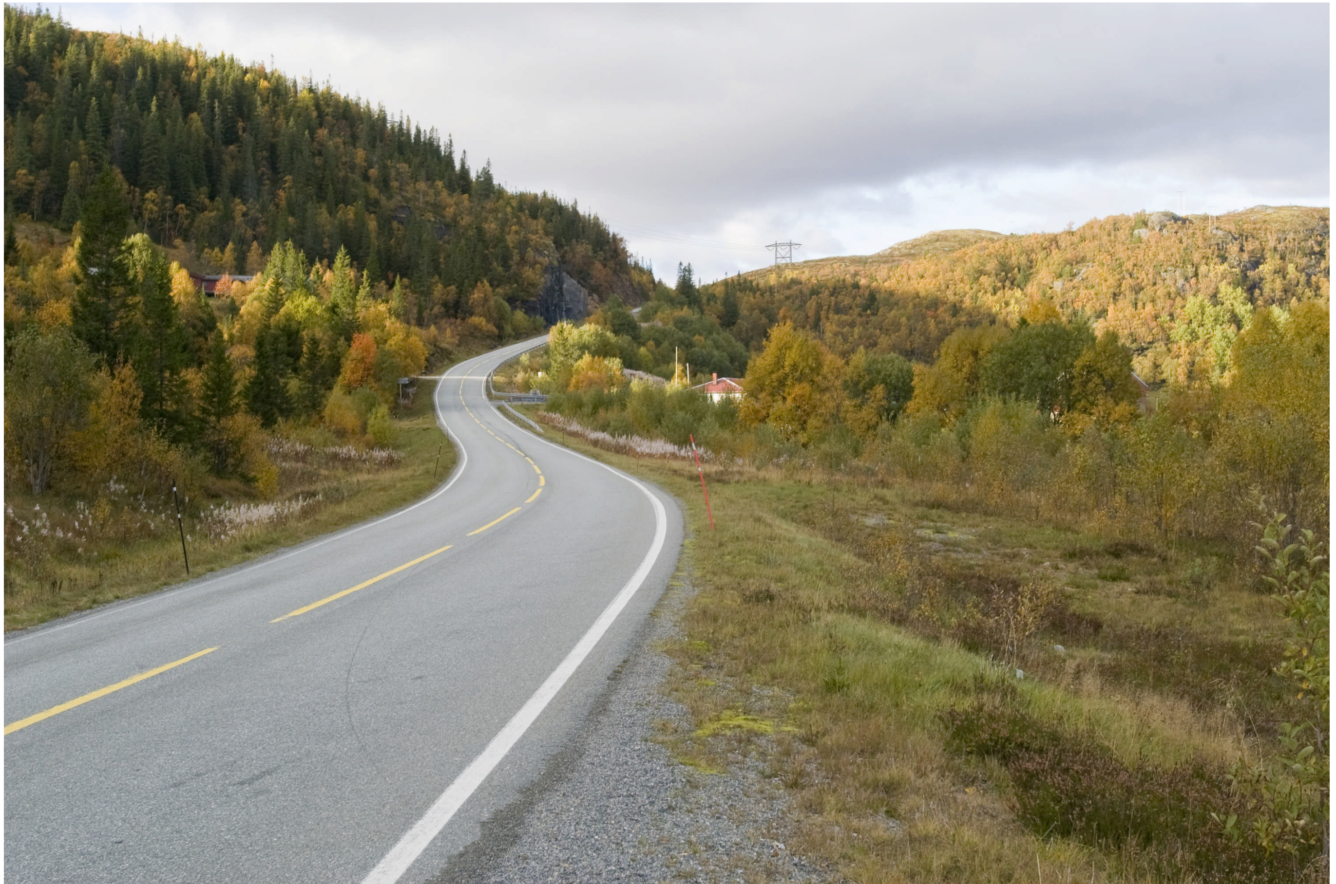
Alternativ 1.0 ved Lonin