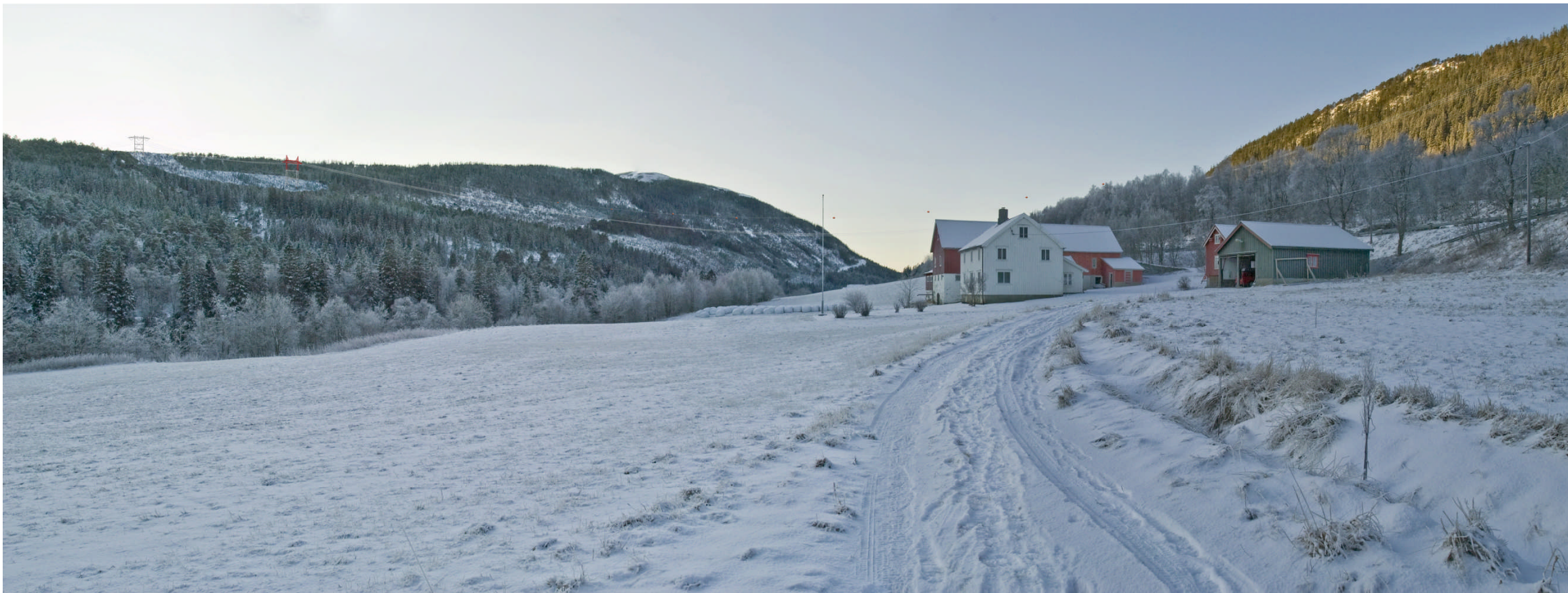
Alternativ 1.0 over Stordalselva – høy føring med flymarkører og varselmaster. Gården Skålvika foran i bildet.