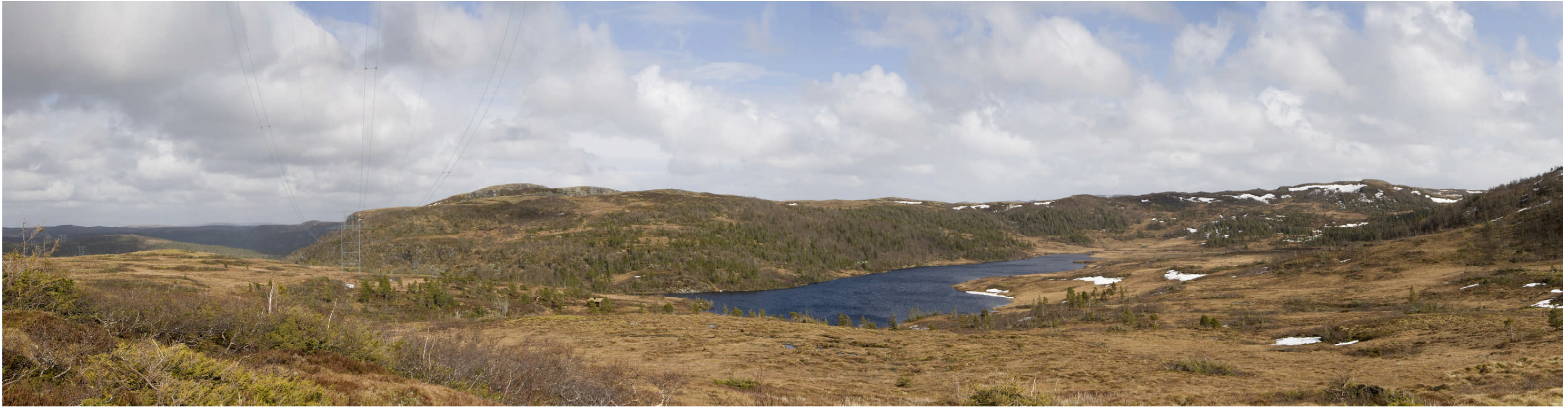
Alternativ 1.1 ved Øverdalssetra