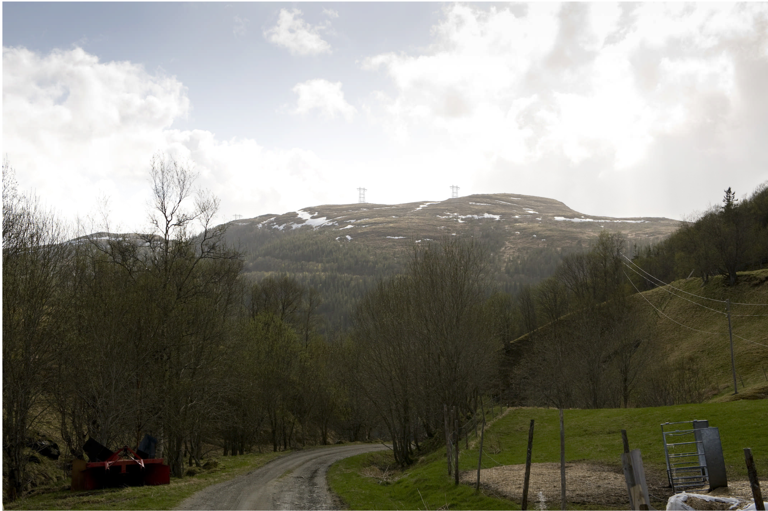
Alternativ 1.0.1 sett fra Storskardet gård.