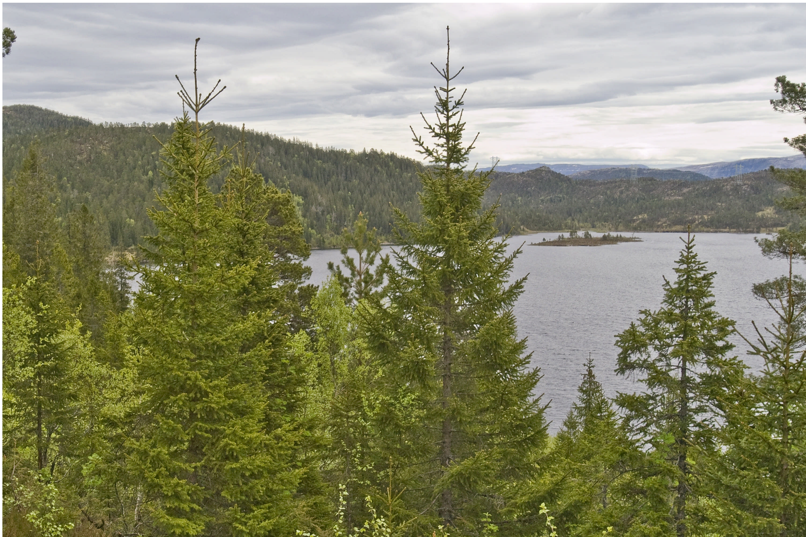
Alternativ 1.0 ved Berdalsvatnet