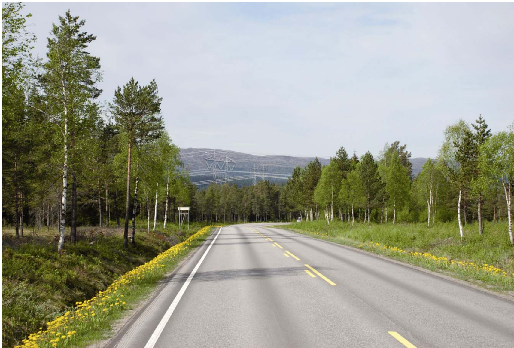
Figur 4. Kryssing riksvei 17, alternativ 2.0.