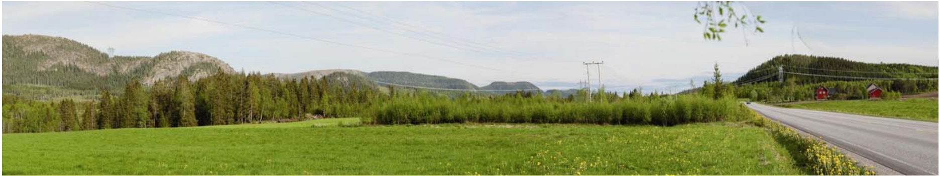
Figur 7. Kryssing Årgårdselva, alternativ 3.0 sett mot sør.