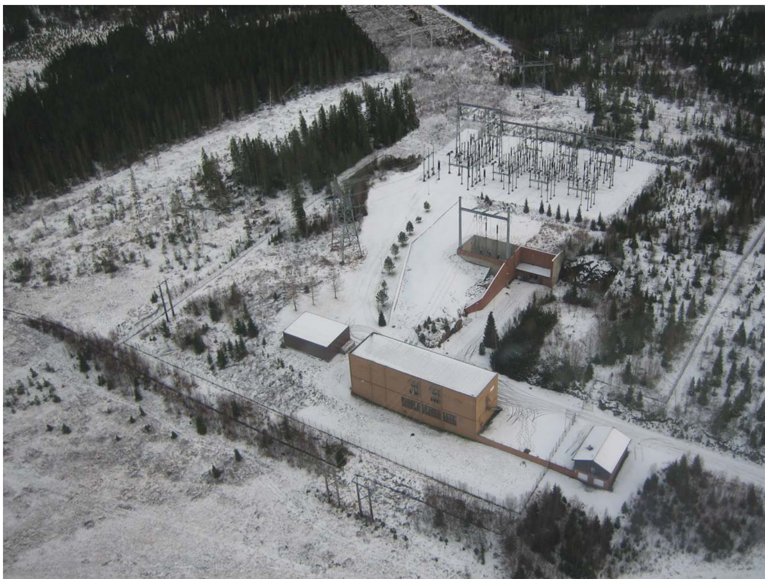
Figur 3. Utvidelse av Namsos transformatorstasjon med ett bryterfelt. Ny 420 kV ledning går ut i venstre billedkant. (Visualisering Asplan Viak)