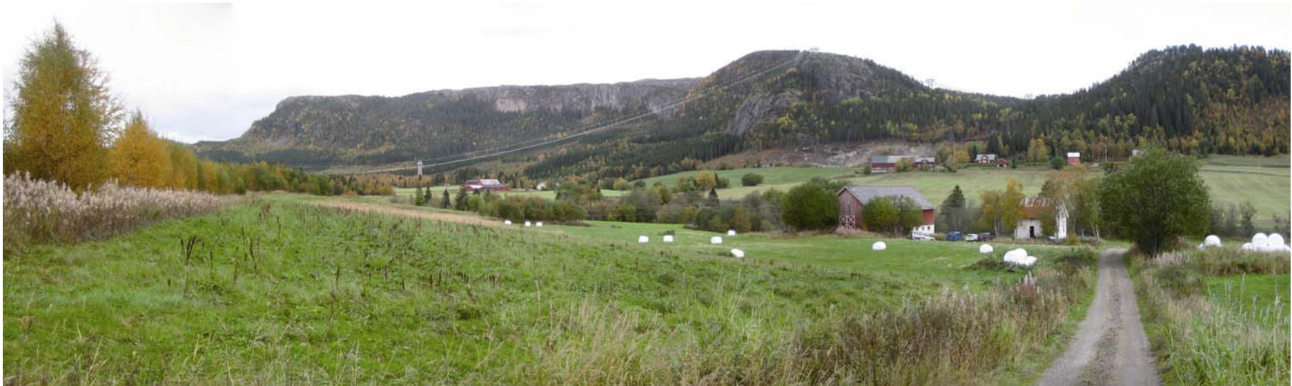
Figur 8. Kryssing Årgårdselva sett fra Buvarp, alternativ 3.1.2 sett mot øst (Foto: Per Reidar Hagen, visualisering Asplan Viak). Alternativ 3.0 vil alternativt gå i skaret på baksiden av Høggammen midt i bildet.