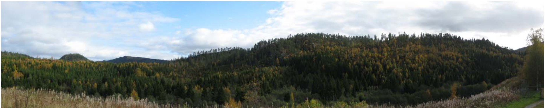
Figur 6. Foto tatt fra Solem skogstue i Namsos i retning alternativ 3.1.1. Ledningen vil gå i bakkant av Andorshatten, den markerte toppen til venstre i bildet. (Foto: Per Reidar Hagen).