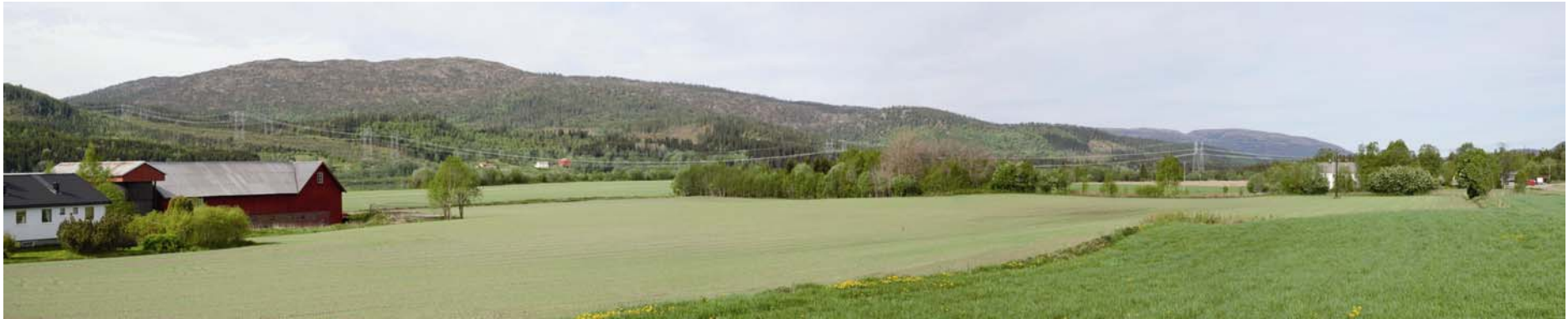
Figur 5. Kryssing Namsen alt. 2.0.