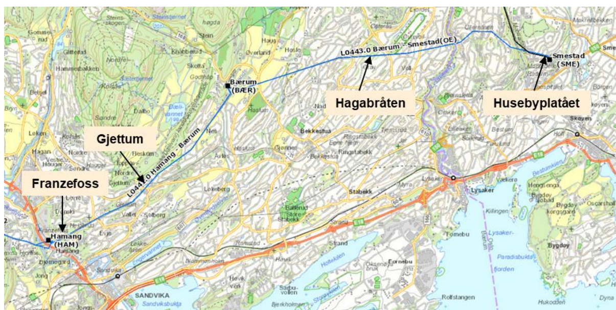
Figur 4: Dagens trase mellom Hamang, Bærum og Smestad

Hvordan dagens luftledning påvirker bebyggelse og muligheter for alternativ arealbruk er noe forskjellig mellom de ulike delstrekningene. Fra nye Hamang stasjon over Franzefossområdet vil store deler av området der dagens Hamang stasjon ligger, bli frigjort ved kabling. Videre fra Franzefoss mot Gjettum går luftledningen forbi en del offentlige bygg, som Bærum sykehus, Martina Hansens hospital og Gjettum skole. Videre fra Gjettum til Bærum stasjon berører luftledningen i hovedsak privatboliger samt areal regulert til landbruk-, natur og friluftsområder (LNF). Fra Bærum stasjon til Hagabråten krysser dagens luftledning mange private eiendommer. Fra Hagabråten til Husebyplatået er det også en rekke private boliger, i tillegg til at ledningen krysser Lysakerelven og Mærradalen. Dette er mye brukte friluftsområder. Den siste biten fra Husebyplatået ned til Smestad stasjon (som ligger under bakken) er et område med stort potensial for boligutvikling. I gjennomgangen som følger tar vi først for oss området fra Hamang mot Bærum. Deretter tar vi for oss strekningen fra Smestad mot Bærum.