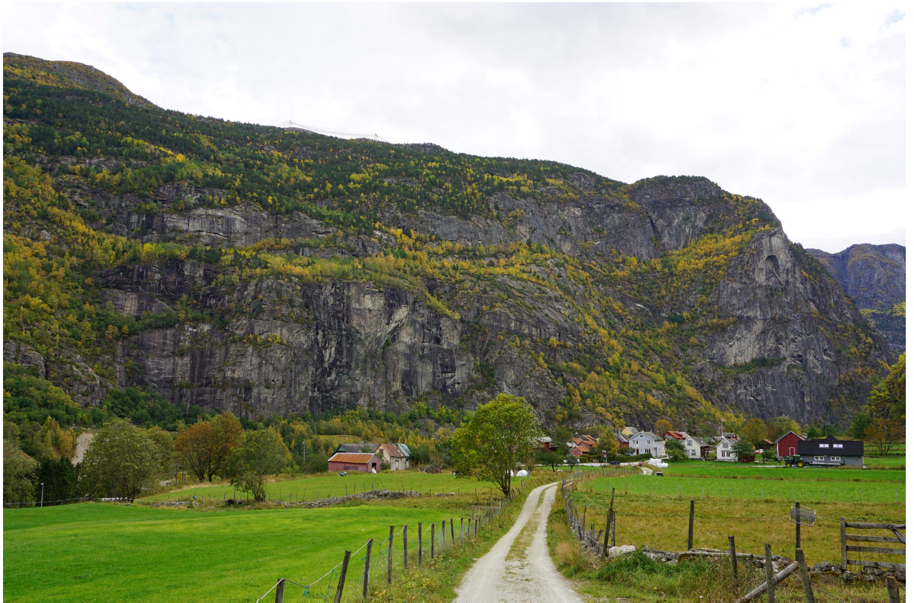
Fra Låvi, visualisering av ny trasé